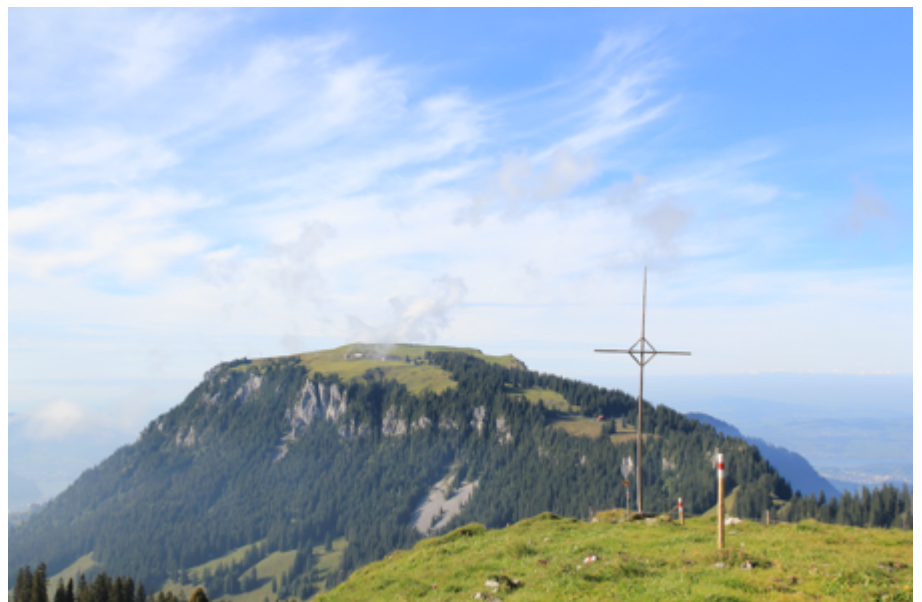
Die Musenalp.