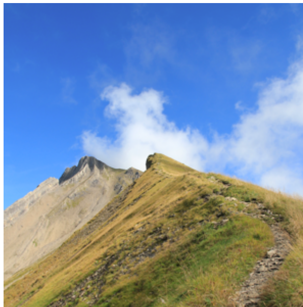
Auf dem Grat dem Brisen entgegen

Unterwegs: Auf der Alp Unterstock und der Alp Bleiki (im Abstieg von der Musenalp über die Rätzele oder den Chästrägerweg) kann man feinsten Alpkäse kaufen.