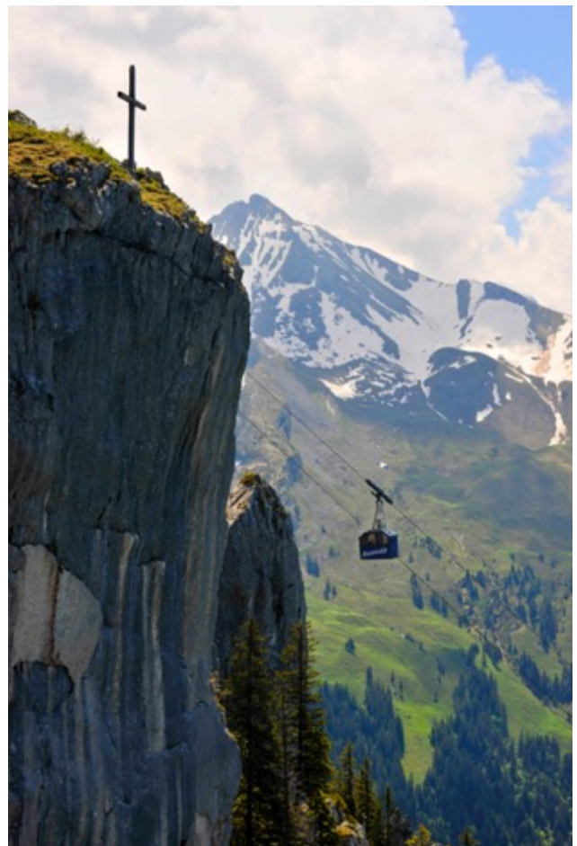
600 Meter überwindet die Musenalpbahn.