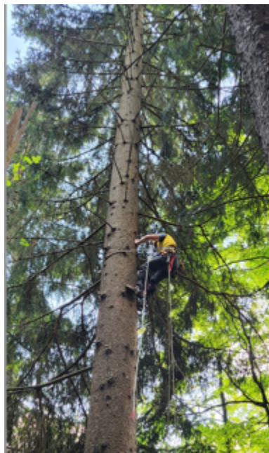
Ein Gleitschirm verfängt sich im Baum. Der Retter ist zur Stelle