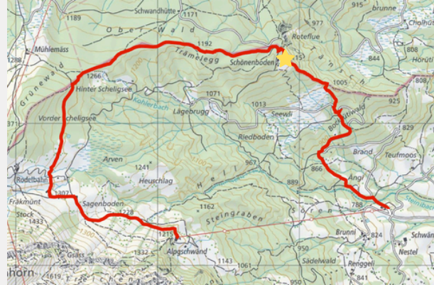
TALSTATION - SCHÖNENBODEN - ALPGSCHWÄND

Schon auf der Bergstation Alpgschwänd zeigen die Wegweiser den Weg in Richtung Schönenboden an. Die Schönenbodenhütte gehört den Hergiswiler Alpenfreunden. Die Wanderung ist einfach, aber aussichtsmässig sehr lohnend. Der gut beschilderte Weg führt teilweise über Weidland und einfachen Wanderwegen zur Schönenbodenhütte. Alternative Bockrütihütte.