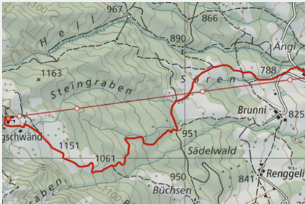
TALSTATION - ALPGSCHWÄND

Gemütlich unterwegs sein und doch ein bisschen wandern. Für diese Freunde empfehlen wir die Route direkt zur Alpgschwänd oder umgekehrt. Die Talfahrt geniesst Du in der Luftseilbahn Alpgschwänd. Entlang dem Bergbach geht es hoch Richtung Alpgschwänd. Immer wieder kann man den Blick auf den Vierwaldstättersee gleiten lassen.