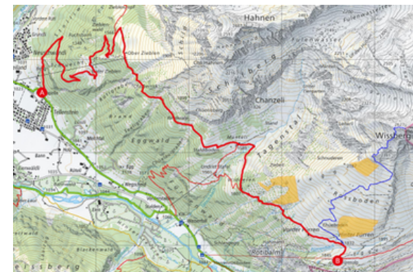
WANDERUNG ÜBER ZIEBLLEN ZUR FÜRENALP

Gestartet wird ca. 90 Meter nach dem Restaurant Schweizerhaus links in den Bergweg Richtung Tellensteinberg zur Oberzieblen und weiter zu Punkt 1631. Ab da geht es auf einem wunderschönen Höhenweg über Rinderalp, Staldiboden zum Mänteli und weiter über den Tätschbach im Tagenstal und Punkt 1607 bis zur Füreanalp.