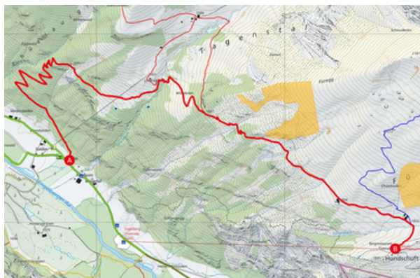
VOM WASSERFALL ZUR FÜRENALP

Gestartet wird beim Restaurant Wasserfall Richtung Engelberg. Nach 100 Metern beginnt rechts der Bergweg zur Füreanalp. Über den Eggwald, unterhalb der Undrist Stafel, Widderen, Punkt 1804 vorbei und über den Füreanalpbach gelangt man zur Bergstation Füreanalp. Unterwegs durchwandert man eine Abbaustelle von Schiefer, welche aber nicht mehr ausgebeutet wird. Doch findet man da noch immer einige schöne Stücke zu Dekarationszwecken.